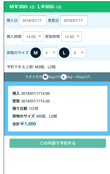
『air locker』 予約画面