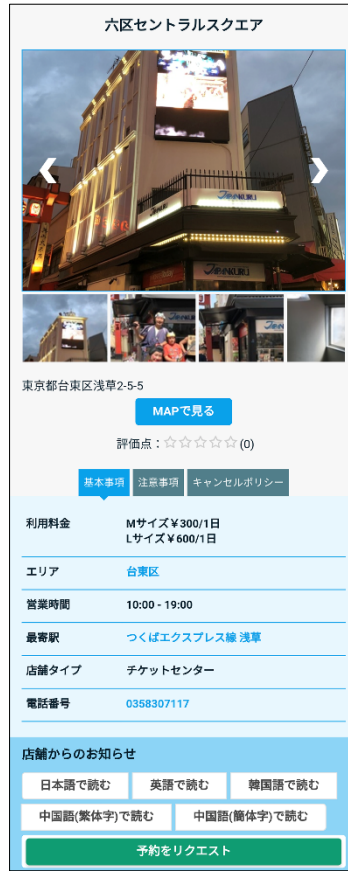
『air locker』 スポット詳細画面