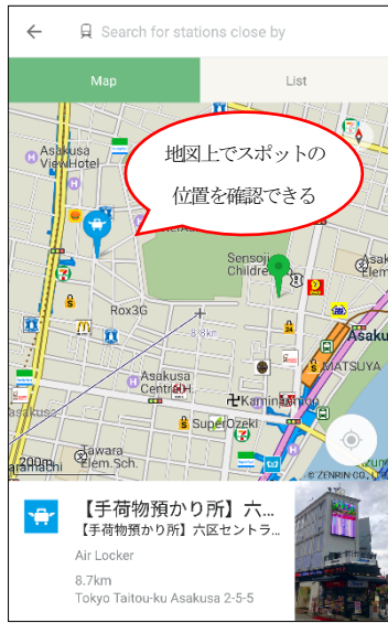
『NAVITIME for Japan Travel』 スポット検索画面